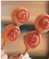
裏面 MAP D

笹かまぼこの老舗「阿部かま」の名 物。蒸しかまぼこの周りに甘いバン ケーキをつけて揚げたアメリカン ドック風の一品。サクサクの衣とか まぼこが絶妙で、大人も子どもも病 みつきに!?