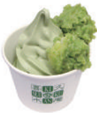
裏面 MAP C

お茶で有名な井ヶ田で大人気の抹茶 ソフトと名物ずんだ餅が2個付いた お得な仙台ならではの一品。数量限 定なので、早めに。もちろん、抹茶 ソフト、濃厚ミルクソフトも人気。