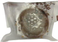
裏面 MAP A

和の素材をアレンジ したフィナンシェ。 「蜂蜜」、「小豆」、「黒 糖」など 10 種類のフ レーパーあり。個人 的には「胡麻」が他 にない味でお気に入り！和の趣の洋菓子店 「九二四四 (きゅうにょんよん)」で販売。