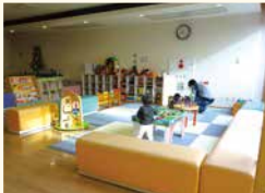
あかちゃんひろば

DATA: 〒980-0021 仙台市青葉区中央2-10-24 仙台市ガス局ショールーム3階 電話/022-726-6181 時間/9:30~17:00 休み/月曜、祝日の翌日(土・日曜、祝日は開館)